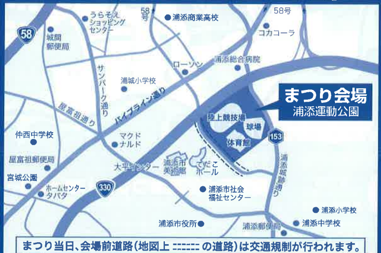
浦添運動公園周辺案内図・Urasoe Athletic Park & Surrounding Area

There may be changes to the program on the day of the event. We ask that you cooperate in carrying your garbage home with you.